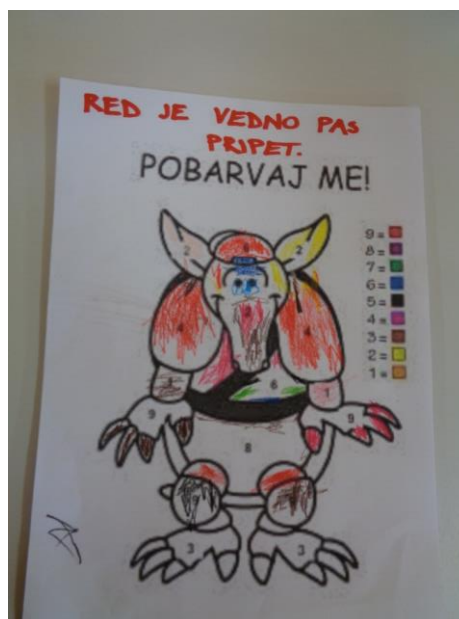
SLIKA: Pobarvanka Pasavček

Otroci so v skupini pobarvali maskoto Pasavčka, ki smo ga nato plastificirale, opremile z varnostnim pasom, nalepkami in vrvico za obešanje. Namen je bil uporabiti pasavčka pri vožnji z avtomobilom. Ko so se otroci usedli v svoj avtosedež so morali tako pasavčka, kot tudi sebe opremiti z varnostnim pasom. V sodelovanju s staršem, ki so otroka pravilno pripeli, so tako usvajali večšine varne vožnje v avtomobilu. Starši so povedali, da so jih otroci opozarjali na pomen pripenjanja, spodbuda so bile tudi priložene nalepke.