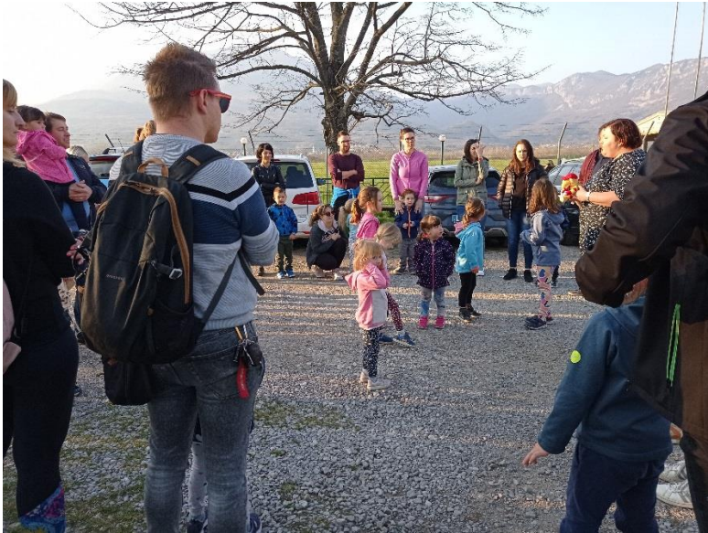
SLIKA: Srečanje s starši – Izlet s Pasavčkom