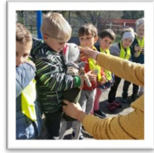
Skupina Lune, Vipava