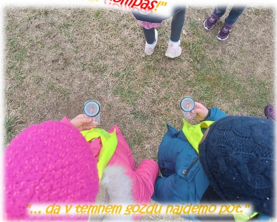
"... da v temnem gozdu najdemo pot."