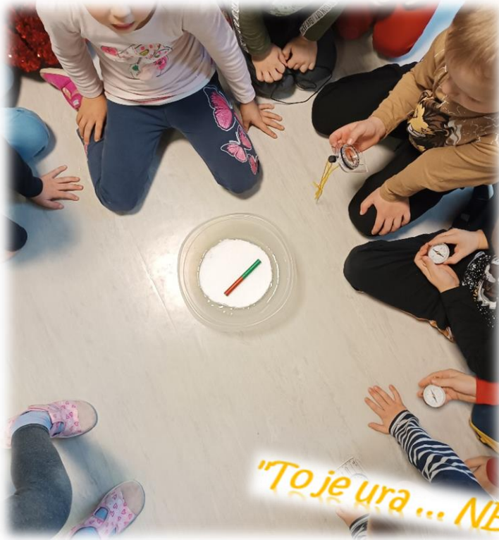
"To je ura ... NE, to je kompas!"