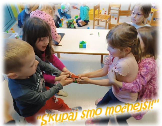
"Skupaj smo močnejši!"