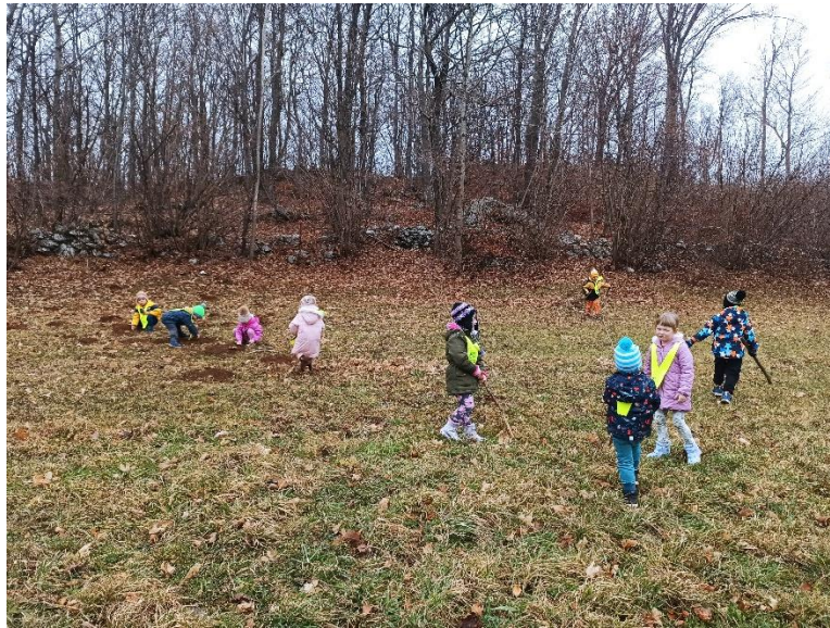
raziskovanje tal in krtin