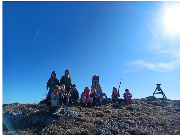
pohod na Otliško okno in Otliški maj