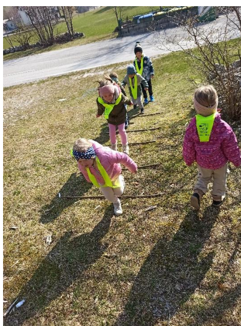
premaganje gibalnih izzivov v naravi