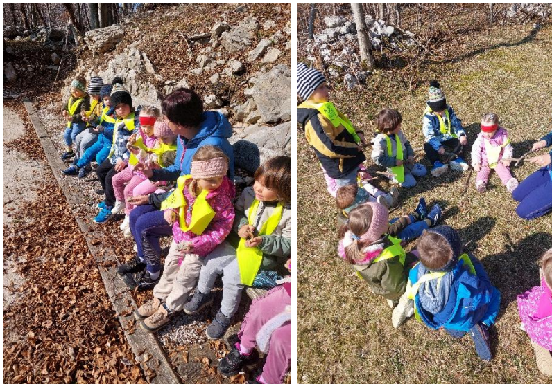
glasbena dejavnost z naravnimi inštrumenti

Gozd pogosto zamenjamo za igralnico v naravi ali pa zgolj za dejavnost, katero izvedemo zunaj, na svežem zraku.